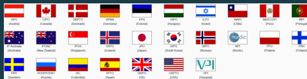
Global PPH: 27 patentmyndigheder