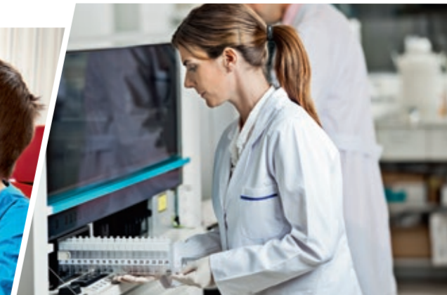
Temaerne udgør en rød tråd i Akademiets arbejde og sikrer fleksibilitet og vedholdenhed.